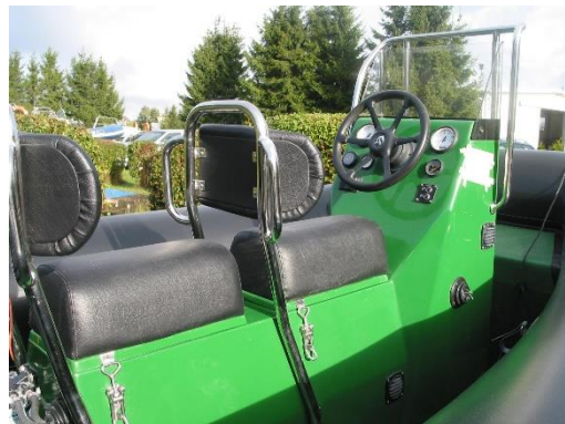
Sedačka typu jockey