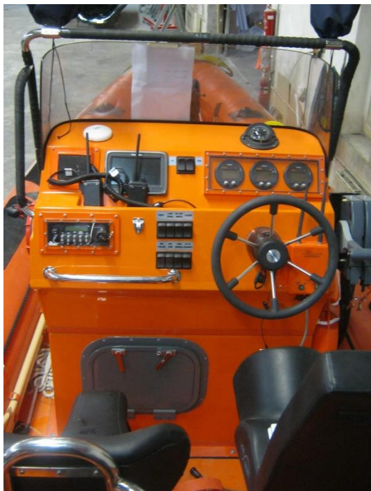
Řídící konzole typu 6200