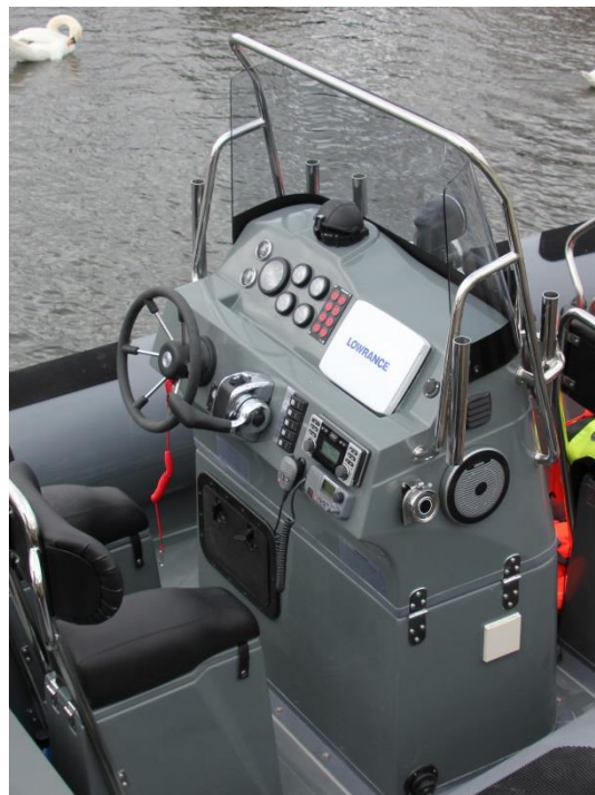
Řídící konzole typu 6800